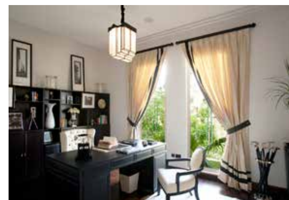
Рабочий кабинет виллы комплекса Al Barari

посетить люди, не являющиеся резидентами комплекса или их гостями, является ресторан органической кухни The Farm. Утопающий в зелени The Farm — это больше чем просто ресторан, это кулинарный и социальный центр досуга для жителей ОАЭ, которые хотят приятно провести время и насладиться вкусной едой с семьей и друзьями. Философия The Farm проста — это здоровое питание в непринужденной и спокойной обстановке. При создании блюд, подающихся здесь, шеф-повара были вдохновлены самыми разными кухнями мира — от тайской и средиземноморской до ближневосточной и индийской.