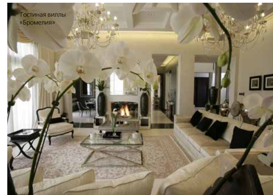
Гостиная виллы «Бромелия»