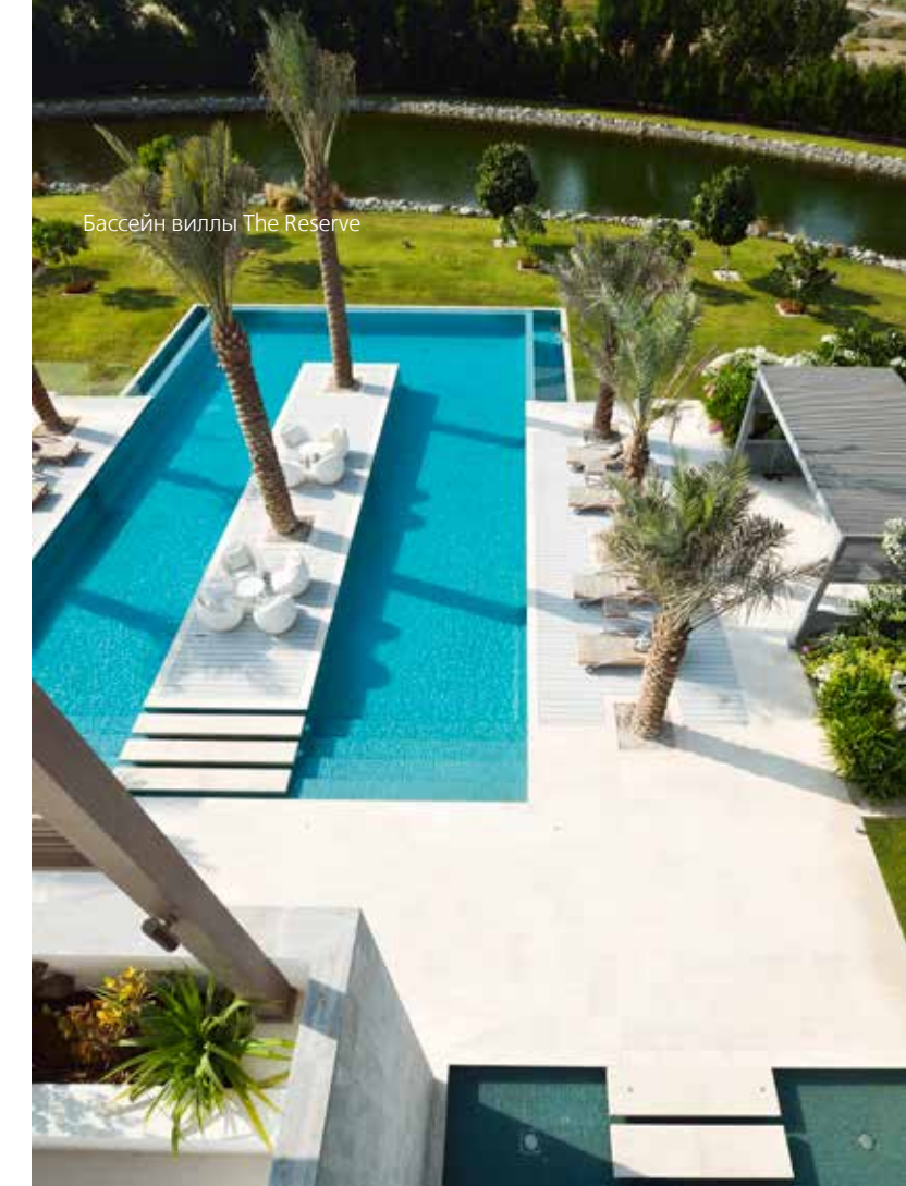
Бассейн виллы The Reserve