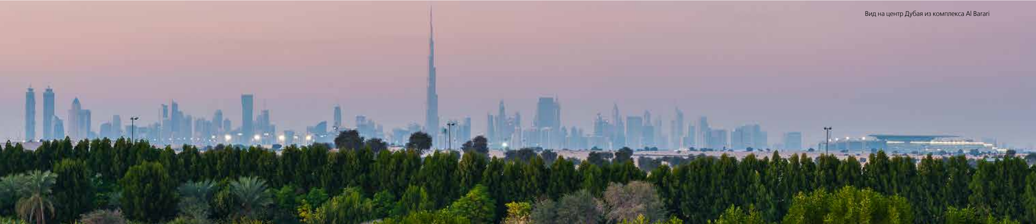
Вид на центр Дубая из комплекса Al Baragi