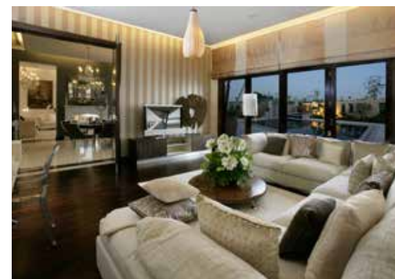
Гостиная комната виллы комплекса Al Barari

На территории Al Barari будет разбито 34 тематических сада, работа над 6 из которых уже окончена. В них произрастает 800 видов редких растений, за которыми ежедневно ухаживают более 100 садовников. Это Лесной сад, Сад Ренессанса, Средиземноморский сад, Балинезийский сад, Сад Современности и Водный сад, являющийся на самом деле озером, привлекающим огромное количество птиц. Единственным местом в Al Barari, которое могут