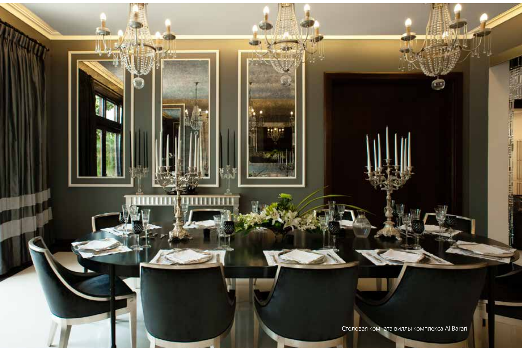
Столовая комната виллы комплекса Al Barari