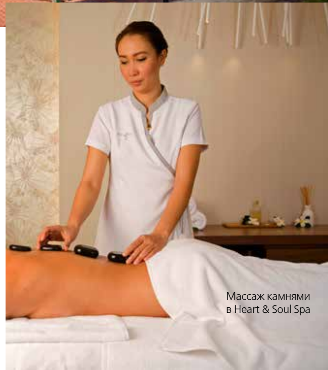
Массаж камнями в Heart & Soul Spa