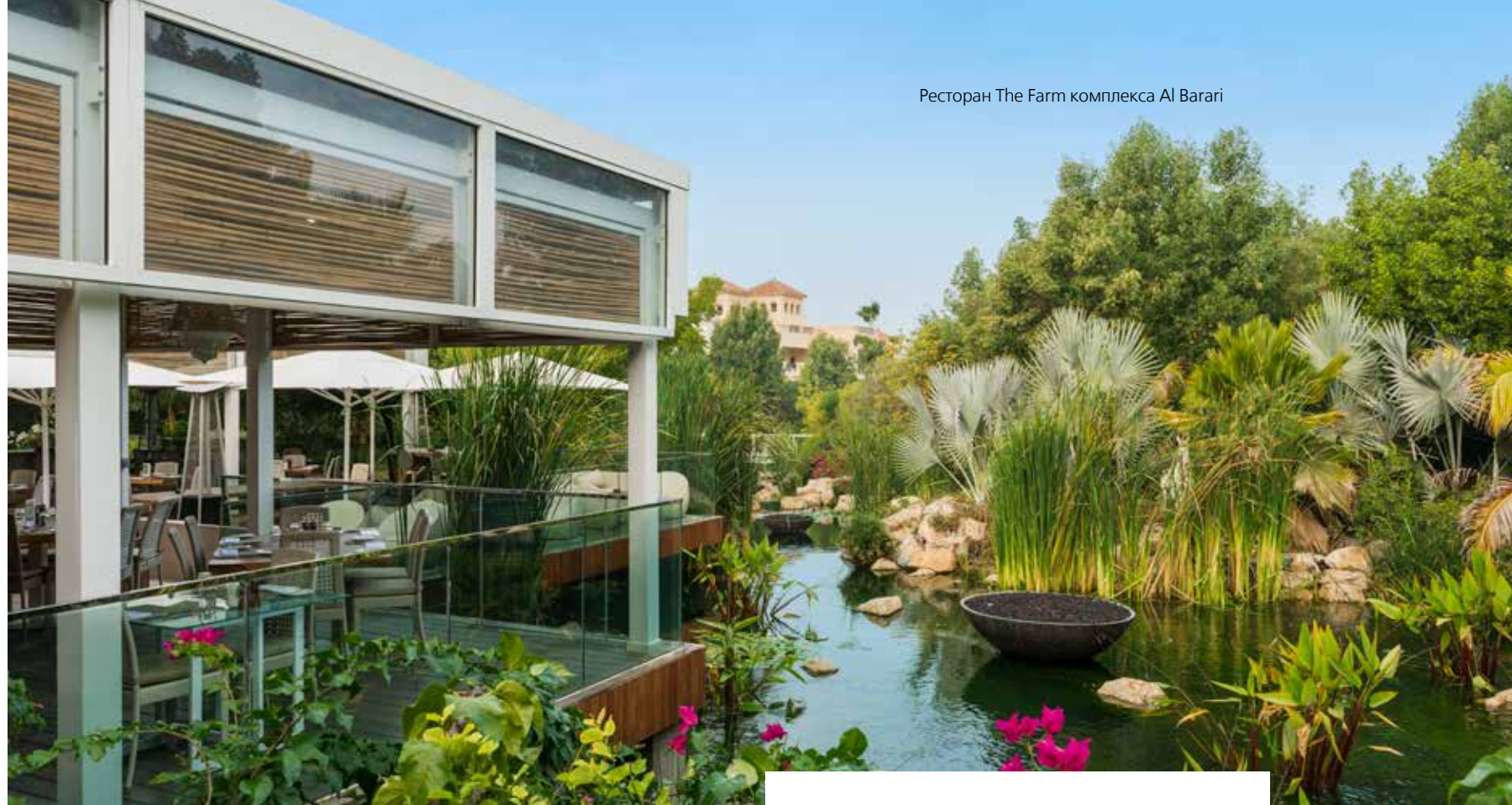
Ресторан The Farm комплекса Al Barari