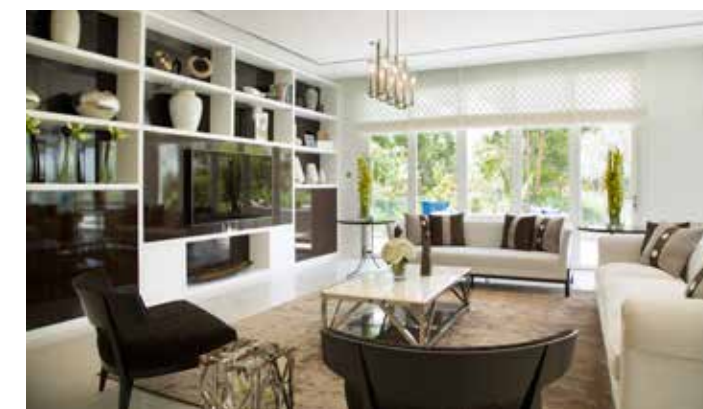
Примеры интерьерного решения апартаментов в Ashjar

«Ashjar» в переводе с арабского означает «деревья», и так как сутью проекта является единение с природой, данное название, по задумке его создателей, подходит как нельзя лучше.