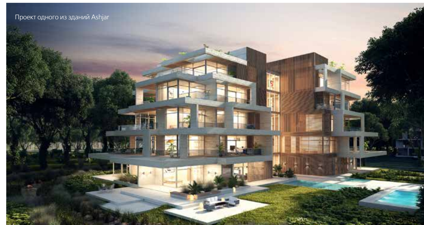
Проект одного из зданий Ashjar