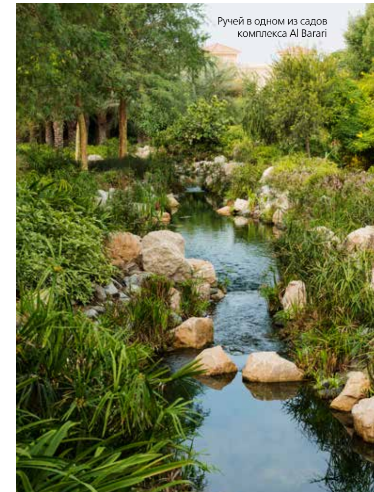
Ручей в одном из садов комплекса Al Barari