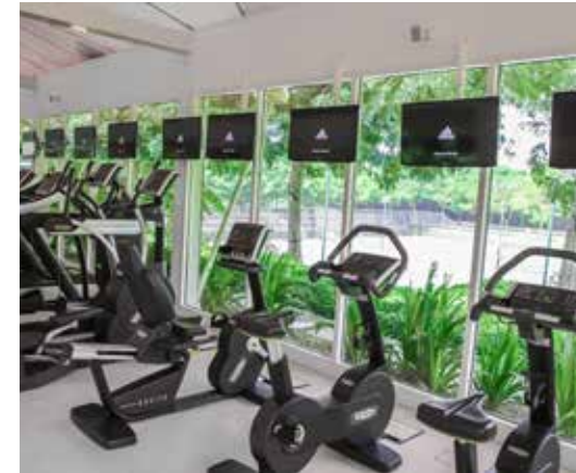
Тренажерный зал клуба Body Language