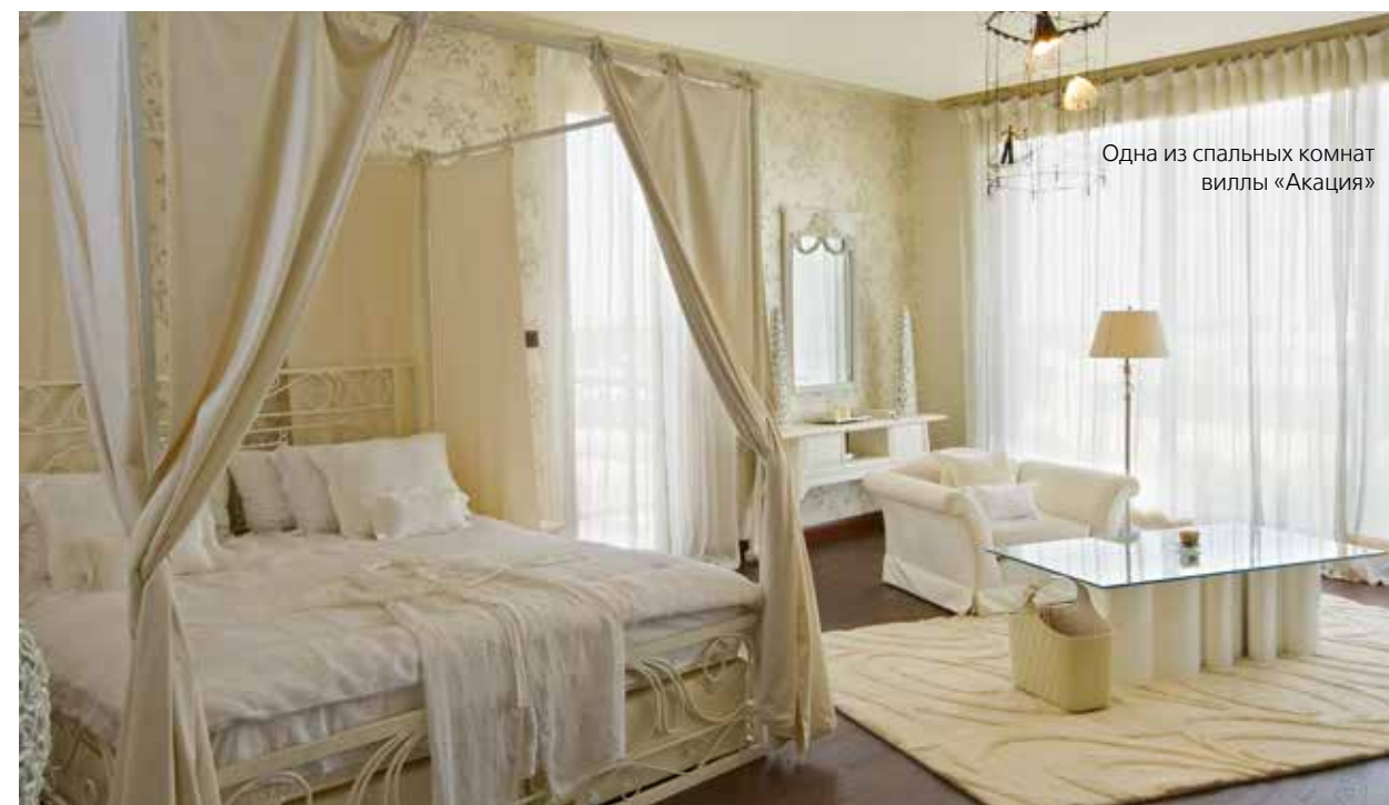
Одна из спальных комнат виллы «Акация»