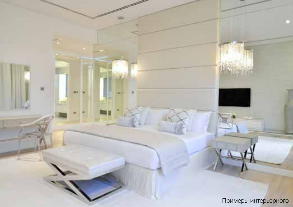
Примеры интерьерного решения апартаментов в Seventh Heaven

садам. 80% апартаментов будут оснащены личными лифтами. Благодаря безрамному остеклению от пола до потолка естественный свет будет проникать внутрь апартаментов. Поток естественного света в интерьере является частью энергоэффективного дизайна, что позволит снизить потребность в искусственном освещении. Естественная цветовая палитра и использование таких натуральных материалов, как камень и дерево, сделают интеграцию дома в окружающую его среду еще более плавной. Природная тема является основополагающей, в частности в холле будет использовано вертикальное озеленение, идеально сочетающееся с окружающими садами.