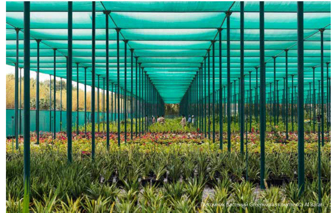
Питомник растений Greenworks комплекса Al Barari

рассказывается о растениях, об экологии в целом и об экономии воды. Кстати, вся вода в бассейнах, искусственных озерах и реках, находящихся на территории комплекса Al Barari, используется повторно. Здесь также задействована технология естественной фильтрации воды при помощи камышовых фильтров. Ни в одном из водоемов не используются какие-либо химикаты или искусственные очистители воды.